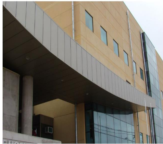
El hospital Las Higuieras de Talcahuano (foto de archivo).

Derecho: Toda persona tiene derecho a la libre circulación y a elegir libremente su residencia